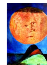
Travnatý ostrůvek olej 1985