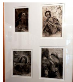
Kalvarie I. / Veronika II. Job s vlaštovkami / Rebeka