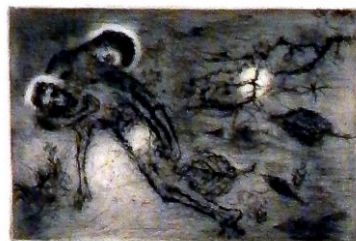
Pieta V. (1965, C4)