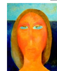
Dívka olej 1991