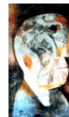
Profil muže olej 1986