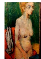
Půlakt olej 1942