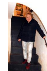
vstup do sklepení