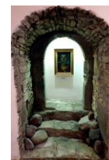
Autoportret olej 1942