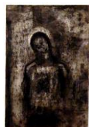
Veronika III. (1955, C4)