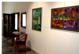
vstup do galerie