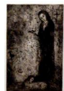
Abel (1955, C3)