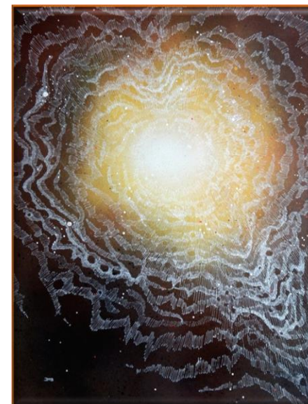
K110 – Valentýnské téma II.