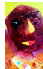
Klaun olej 1985