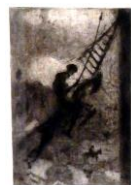
Don Quijete - Větrné mlýny