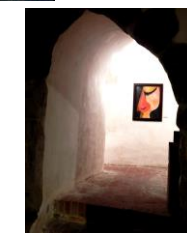
Hlava I. Olej 1985