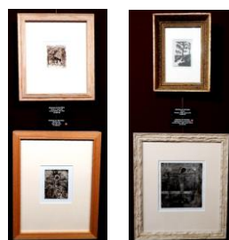
Kozy v zahradě / Ukřižování Cesta / Ukřižování