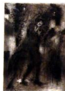
Don Quijete I. (1955, C4)