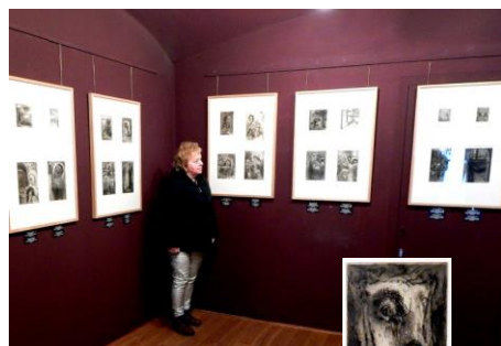
expoze v grafickém kabinetu