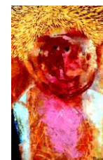
Portrét zpěvačky olej 1985