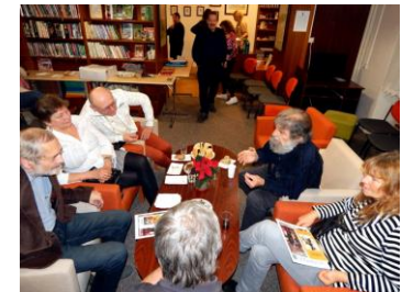
v čítárně bylo veselo