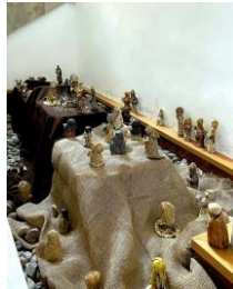
betlém pod schody