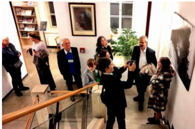
expozece na schodech