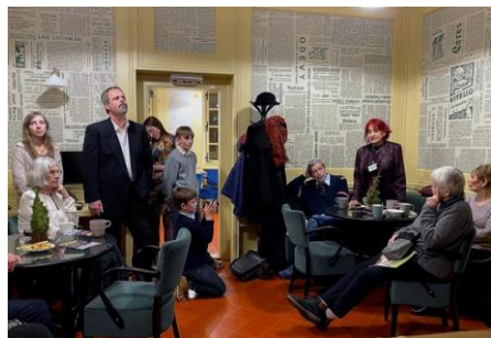
vernisaž na Příhrádku