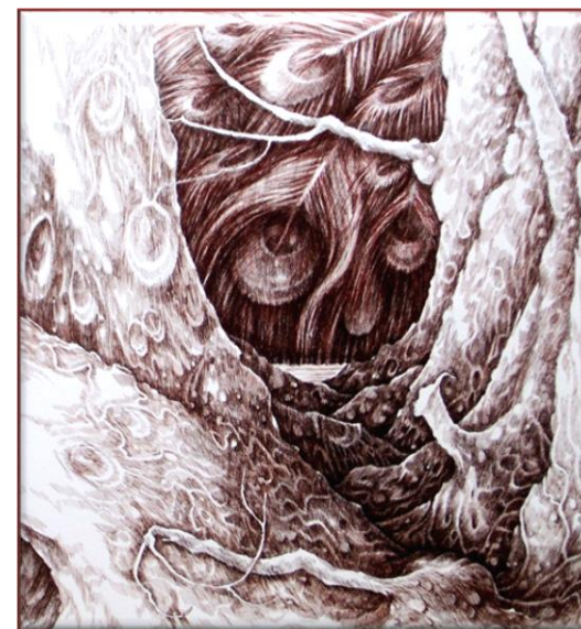
Paví háj II. Peacocks' grove II.