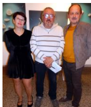
autor s organizátory

Výtvarník měl (v období 1980-2024) 21 samostatných výstav: např. Rusko-Omsk-,Novorosijsk, Německo-Erlangen, Nizozemí-Federikshaven, Praha, Děčín, Prostějov, Pardubice, Lysá n. L., zámek Kozel, Šumperk a také Lanškroun. Zúčastnil se na 81 kolektivních výstav či soutěží, prakticky po celé Evropě. Rusko, GB, Polsko, Itálie, Švýcarsko, Srbsko, Čína, Španělsko, Rumunsko, Bulharsko, Slovensko, atp. ■