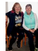
Maru a Iva