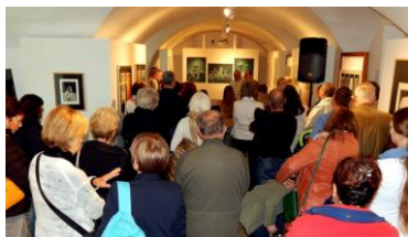
pohled na čelo konírny