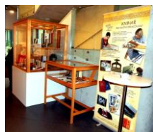
SOŠ a SOU knihář