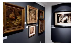
„Maruška“ 92 / 9 let