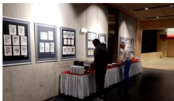
vstup do sálu

kroun je pro JMB jeho 110. výstavou v celkovém pořadí. Lanškrounští organizátoři rozšířili původní hradeckou expozici o práce ze ZUŠ J. Pravečka a ZŠ A. Jiráka - Lanškroun. Dále o expozici SOŠ / SOU Lanškroun - v oboru knihář. ■