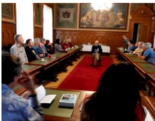
čtení ze sborníku