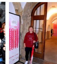
vstup do galerie