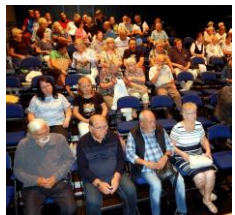
přítomní diváci a nadšenci