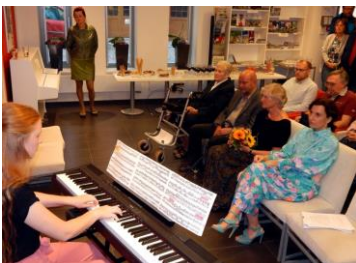
úvodní část vernisáže