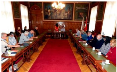
čelní strana historického sálu - literáti