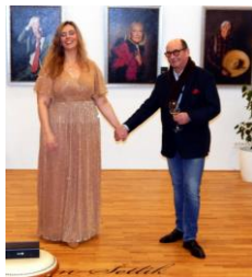
hlavní aktéři vernisáže