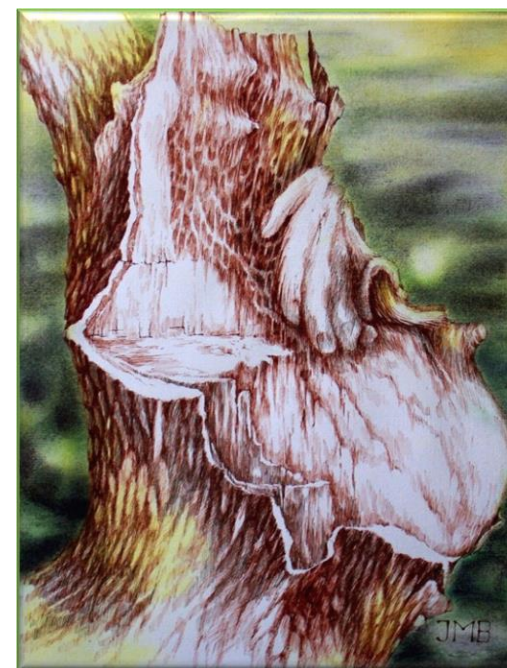
Evolution - gravidity Evolution - Gravidity