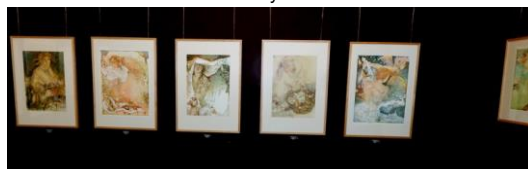
expoziční Grafického kabinetu