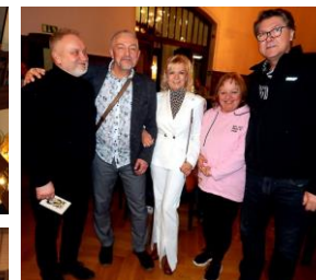
p. Kitzberger a Kociánští