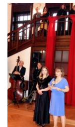
prapra + pravnučka