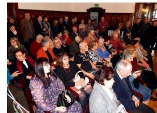
pohled do publika