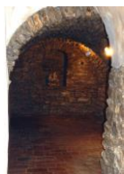
historické sklepení z přelomu 14. a 15. století