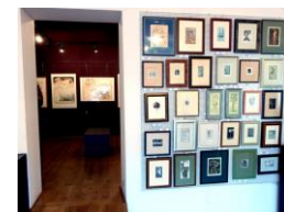
vstup do Grafického kabinetu

Ročník XIII., vyšlo 15. března 2024. Redakce a spolupracovníci, Homepage: www.jmb-obrazy.cz , kontakt: smejkalv.jmb@email.cz