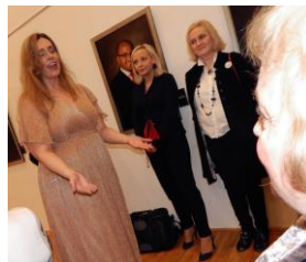
sympatická diva si diváky získala