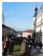
Galerie ART na dohled