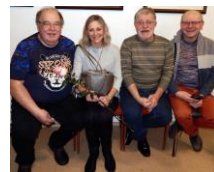
přátelé z Litomyšle a D.Č.