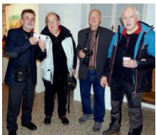
um. kovář 1 a řezbář 4