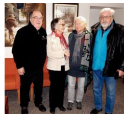
zástupci SPSE z H. Králové