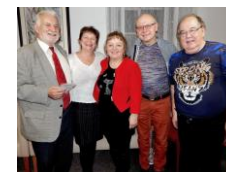
přátelé z Litomyšle a LA