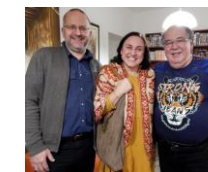
přátelé z Pardubic