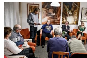
úvodní slovo R. Lepky *