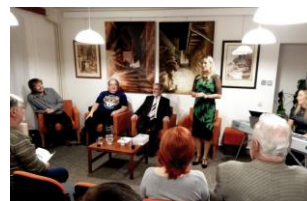
představení aktérů ředitelkou MK

Blaho lidu, ať je nejvyšším zákonem (Salus populi suprema lex esto) /Cicero/