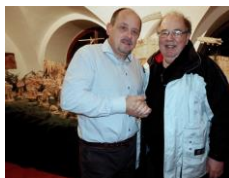
LA betlém, Čada J.