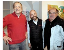
malíř 1 a starosta 2