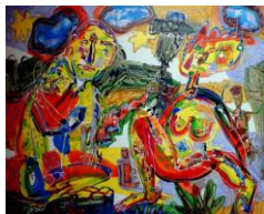
Kříklava: Letní den