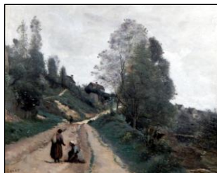
Poblíž Cantilli v ceně 4,5 mil. Kč