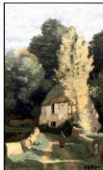
Dům u lesa 2,2 mil. Kč