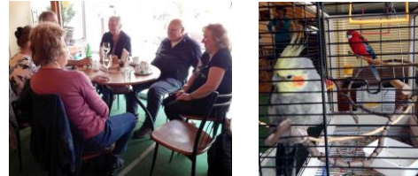
do diskuze se často hlasitě připojoval tento opeřeneč

V úterý 6. června 2023 přivítala Laskavárna v Mor. Třebové setkání přátel a příznivců grafiky. Přítomní jsou členy SSPE Praha. ■