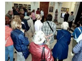
představení rodiny Jelenových