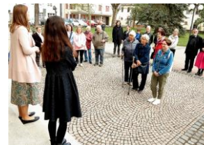
zahájení Muzejní noci