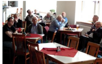
pohled do sálu