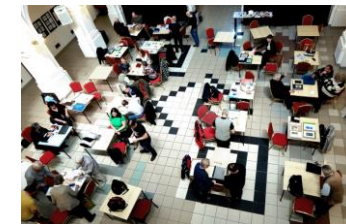
pohled do dvorany muzea

Bez přátelství nestojí život za nic. / Cicero /