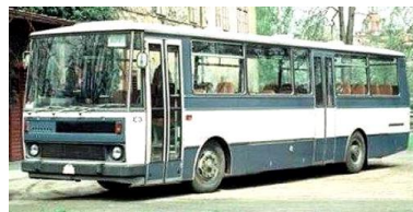
Karosa C 734

jsem se začal zúčastňovat výrobních porad a konzultací, kreslit návrhy a zhotovovat, převážně sádrové modely autobusů a detailů vnitřní výbavy. V interiéru vozidel bylo vždy nejvíce řešeno, od potahů sedaček, konzol až po palubní desku. Bylo nutné vše sladit barevně, včetně vnějšího olakování. A tady jsme naráželi na málo kvalitní tuzemské barvy a na neochotu dodavatelů vyrobit třeba světlomety a blinkry podle našich představ, ale museli jsme se my přizpůsobit tvarově jejich neměnnému sortimentu. Dnes si objedná výtvarník součástku a zítra mu ji nabídne deset firem z EU. V tehdejší RVHP byla akcentována kvantita, a to za co nejmenších nákladů. Proto byla všeobecná neochota vedení podniků něco měnit a utrácet, když to fungovalo. Měl jsem nakonec štěstí, že se začala logicky vyvíjet nová řada autobusů M, C a LC 700, ten hranatý typ, ovlivněný technologií výroby, který získal oblibu i řadu ocenění, na němž jsem se opravdu „vyřádl“. Nakonec jsem ještě před odchodem na volnou nohu stihl vyřešit základní model dálkového autobusu LC 900. To se psal rok 1992. ■