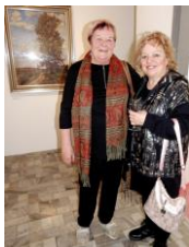
dcera autora (vlevo)