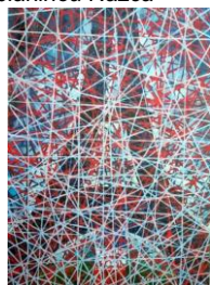
Pocta Gustavu Eiffelovi