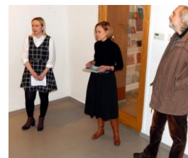
úvod a organizátoři