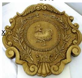
znak České Třebové