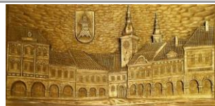
radnice v Ústí n. O.