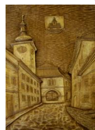
Galerie pod radnicí