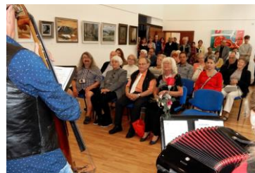
návštěvníci, velký sál