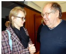
pí D. Pokorná

Ročník XI., vyšlo 3. října 2022. Redakce a spolupracovníci, Homepage: www.jmb-obrazy.cz , kontakt: smejkalv.jmb@email.cz