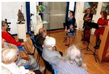
úvodní slovo kurátorky

ticky byly k vidění krajinky, portréty, zátiší, surrealismus a abstrakce. Ve velkém sále galerie byla nainstalována realistická tvorba-krajinky či lesní scenérie ala Šiškin. V menším sále bylo vše ostatní. Především abstraktní tvorba. Osobně mne mrzí, že jsem připravil pro tuto výstavu tři povolené obrazy (2004-2014-2022), které měly evokovat moji výtvarnou cestu za posledních 20 let. Nakonec, mi byl nainstalován pouze jeden obraz! Organizátoři mi pak sdělili, že již nejsou další prostory. Tak snad příště. Jsem rád, že jsem mohl potkat spoustu starých přátel a známých. Pro JMB je tato výstava jeho 104. prezentací v pořadí. ■