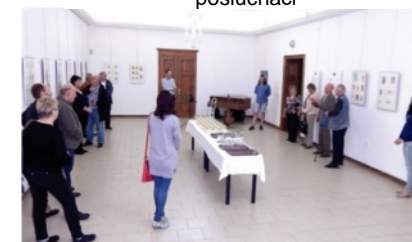
výstavní síň muzea