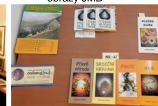
básně Kubiček, ilustrace JMB