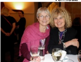
grafičky B.Waageová, E.Vlasáková