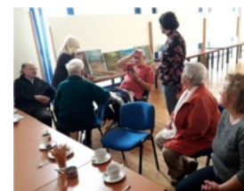
pohoda při instalaci