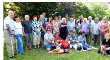
přítomní vystavující autoři