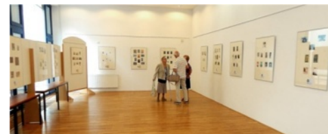
Galerie pod radnicí

Ve světě sběratelství exlibris zažívá velký boom. Bylo by tedy škoda si zhlédnutí této výstavy nechat ujít, tím spíše, že ČR byla pověřena organizací XXXVII. FISAE International Exlibris Congress ( 28. srpna. - 2. září. 2018 ) v Praze a který je uskutečněn při příležitosti 100. výročí založení SSPE. Snad právě proto organizátoři v Ústí nad Orlicí zvolili výstavu bez vernisáže, protože všichni vyznavači grafiky a exlibris obzvláště byli v Praze na kongresu.