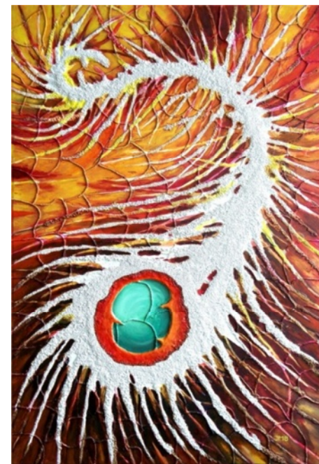
Kompozice III. Composition III.

Art – Vernisages - Exhibitions – Auctions – News – Meetings malíře, grafika a ilustrátora Ing. Václava Smejkala (JMB) Lanškroun