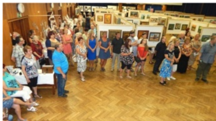
pohled do sálu KD

V předzářní hrála hudba (varhany a kytara). Pro JMB je tato výstava 96. prezentací.