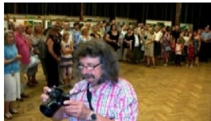
Pohled do sálu Kulturního domu