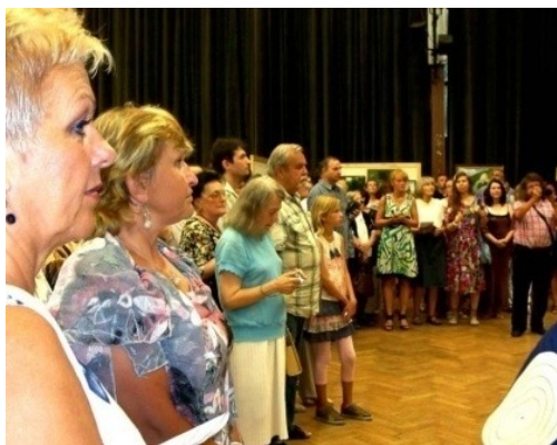
Přítomní návštěvníci vernisáže