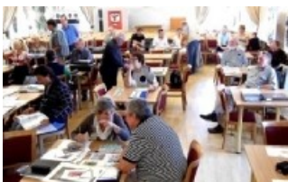
Pohled do Koncertního sálu