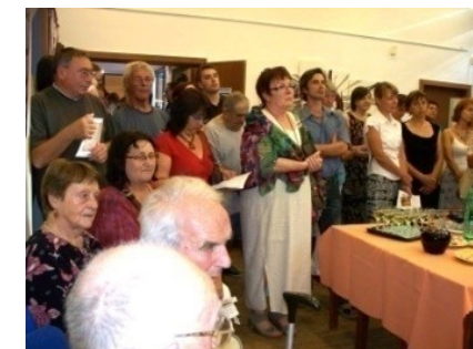
Pohled do sálu Galerie pod radnicí