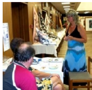
Organizátorky výstavy z Klubcentra