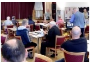
Zahájení a úvodní slovo

nými sběrateli exlibris a velkými nadšenci pro grafiku. Tuto příležitost si také nenechali ujít i výtvarníci. Organizátoři připravili k této příležitosti účastnický list a pro zpestření dopoledního programu i bohatou tombolu o EXL.